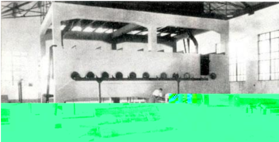
中国第一水工试验所的主体设施

中国第一水工试验所是中国第一个现代水利科研机构，第一个国家级实验室，也是最早的中国水利科学研究机构。该试验所奠定了中国现代科学治水的基础，也标志着现代水利科学研究技术手段在中国落地生根，是中国水利由传统的经验型水利变为现代水利的里程碑。