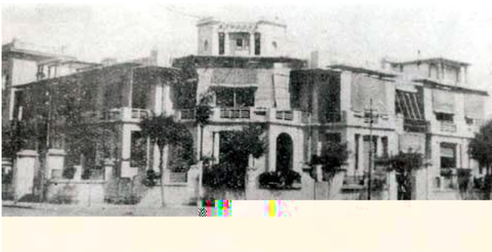
华北水利委员会外景（旧址仍存且已获修复，位于天津市自由 民生 交口西北角）

函示以便接洽”。1931年1月9日，华北水利委员会第67次常务会“决议本会与河北工业学 合办水工试 场各担负开办设备 之一半，由该 拨给场址及由该 挪出一万五千元现款外并由本会于每次 到经 中储存十分之一作为专款 同该 专款交由双方合组之保管，委员会负 保管以作将来建筑及设备之用”。并 成协议：1、河工试 场改称水工试 场，建筑在河北省立工业学 内；2、试 场的规划设计，由工业学 水工讲师李 博士筹办；3、参建单位各尽 力所能，自认投 数 ，差 分协商解决；4、试 场建成后，由工业学 代管，管理办法另定。至此，河北省立工业学 成为最早与华北水利委员会合办水工试 所的学术机关。